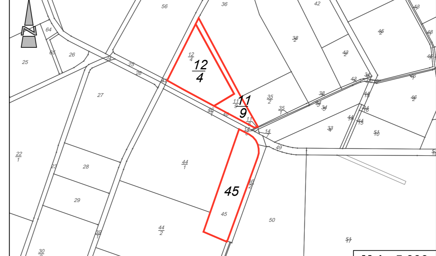
Flurstücke 12/4 und 11/9 in der Flur 37 sowie Flurstück 45 in der Flur 44, Gemarkung Bockhorn, Gemeinde Bockhorn