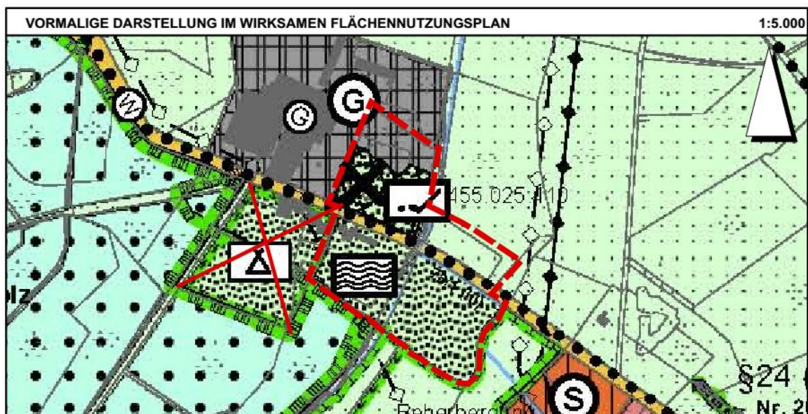
Abb. 3: Aktuelle Darstellungen des FNP 2009

Dementsprechend wird die 5. Änderung des Flächennutzungsplanes im sog. Parallelverfahren gem. § 8 Abs. 3 BauGB durchgeführt, auf den entsprechenden Entwurf wird verwiesen.